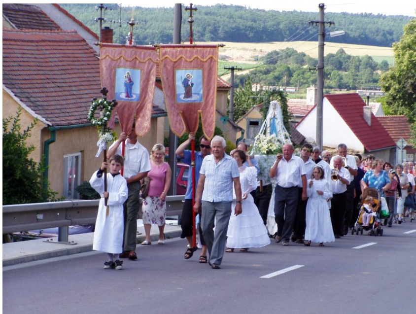
poutní procesí vychází ....

šlo do kostela na mši. Potom bylo ubytování (u místních na seně, v hostinci, poutních domech ale běžně i na zemi v ambitu okolo kostela – což byla jeho hlavní funkce). Ráno byla hlavní mše a po ní návrat domů. Na hranici domácí plužiny bylo slavnostní uvítání ostatními a v kostele společná děkovná pobožnost.