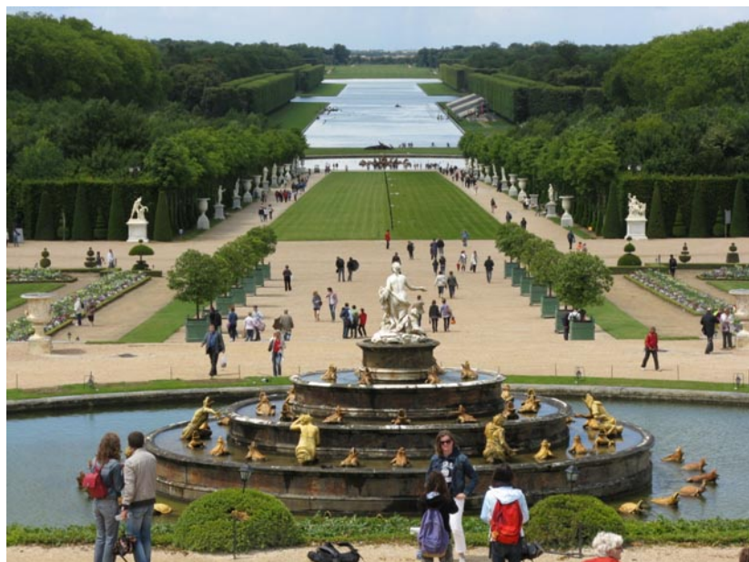
Soukromá zahrada Francouzského krále zámku Versailles

Francouzské zahrady již signalizují jednak vybití všech nebezpečných šelem v krajině, jednak zvýšenou bezpečnost i mimo hradby, což umožňuje volně vstoupit do krajiny. Potřebné nahledy vytváří i umělé terasy.