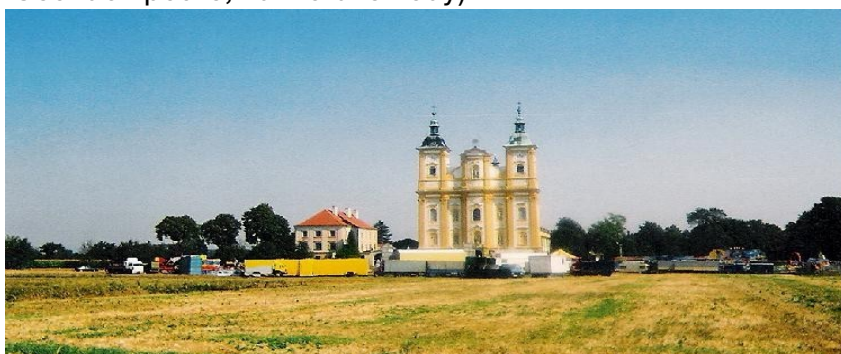
poutní kostel v Dubu na Moravě

Významnou roli hrálo a hraje zasvěcení a vysvěcení místních kostelů. Je třeba odlišovat datum vysvěcení kostela („narozeniny“ - této slavnosti se říká posvěcení = posvícení), od svátku Patrona, jemuž byl kostel zasvěcen („jmeniny“ - této slavnosti se říká v Čechách poutě, na Moravě hody).