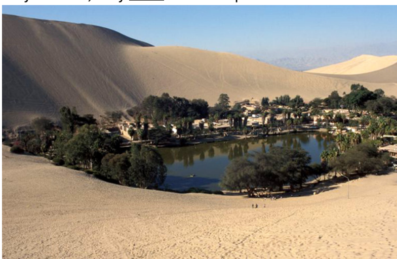
Oáza v poušti

Předobrazem ráje v aridních, biblických oblastech je logicky místo s dostatkem vody a tedy i zeleně, tedy oáza v bezlesé poušti.