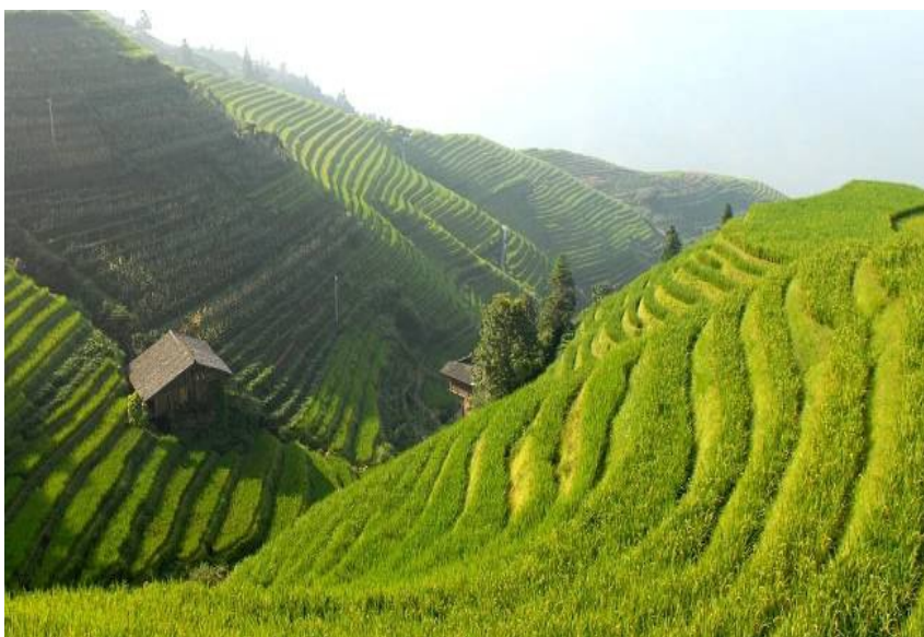
Monoplodiny čajovníku se singularitou obydlí

Čínské zahrady vychází především z pojetí posvátnosti krajiny v taoismu i konfucianismu. Krajina je tam dvojího typu – první jsou málo obydlené oblasti hor chápané jako vztah dvou komponent – hor (skal) a vody. Druhý, přelidněný rovinatý typ je tvořen obrovskými plochami monoplodin (rýže, obilí) všude kde je to možné, přičemž okraje ploch jsou tvořeny džunglí. I tradiční čínská zahrada symbolizuje ráj na světě. Krajina je však zde úsporně prezentována jejím výsekem znaků (omezeným někdy až na kompozici jediného stromu či větve), či zmenšeným modelem celé krajiny (japonské zahrady). V duchu taoismu (tao=cesta) se v zahradách střídají a doladují scény zmenšeného krajinného záběru v přesně daném pořadí. Vytváří tak skutečnou cestu, která přestože ji tvoří více scén, zachovává jednotu celku.