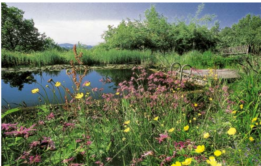
Biotop tůň jako koupací jezírko

Někdy ale jde o umělou podporu biodiverzity i vzhledu.