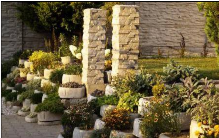
Touha po jihu – jižanská zahrádka

- Zjednodušeně lze říci že hmotným výsledkem prvního, tradičního přístupu jsou snahy v rámci možností přizpůsobovat a " zkrášlovat " si své teritorium , což je i základem lidového umění. Snaha o přizpůsobení místa podle subjektivní vize vede až ke koncepcím psychocenóz – ve velkém v okrasných zahradách a parcích, v malém k aquaparkům ale i teráriím a akváriím.