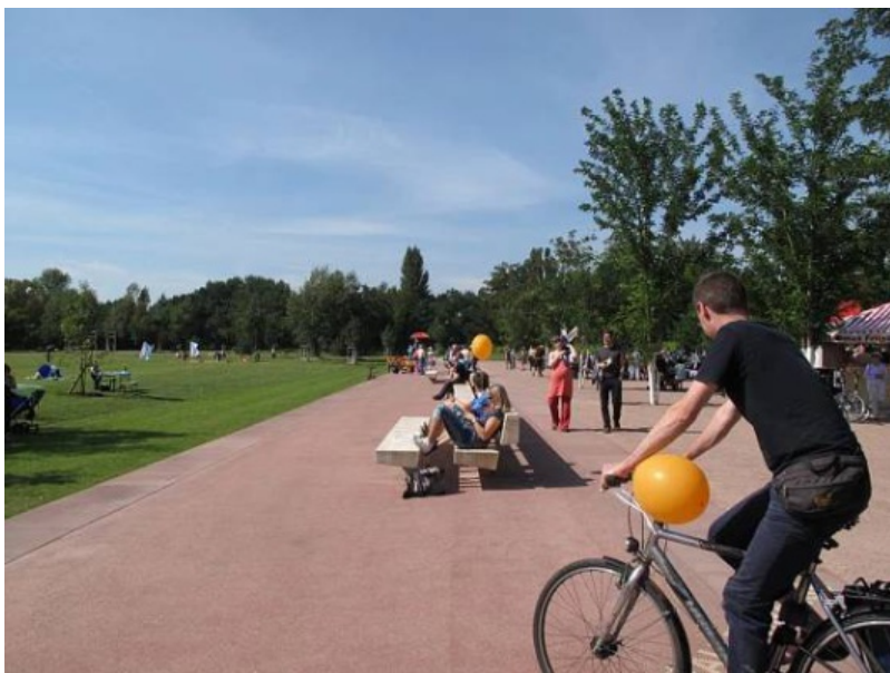
Městský park s návštěvníky, příklad pocitově bezpečného prostředí