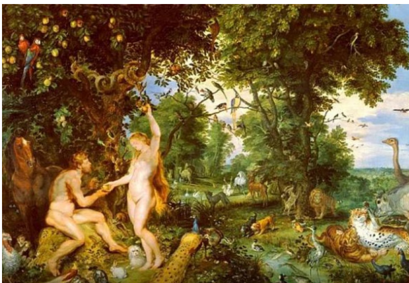
J. Brueghel st. -P.P.Rubens – Rajská zahrada

Daleko reálnější jsou zmíněné krajinné singularity – tedy vzácné krajiny výrazně odlišné od okolních, běžných.