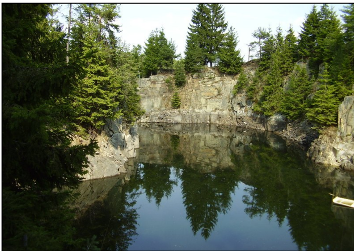
Biotop opuštěného kamenolomu

Inspirace je hledána v zvláště dramatických přírodních singularitách jak abiotických, tak živých. Ze stejného pojetí vychází i současné módní „zelené střechy a stěny“ (ve skutečnosti střechy pokryté suchomilnou, často exotickou vegetací, v případě stěn složitou soustavou pod sebou zavěšených truhlíků se závlahou, vytvářejících z popínavých rostlin iluzi vysoké vegetační stěny).