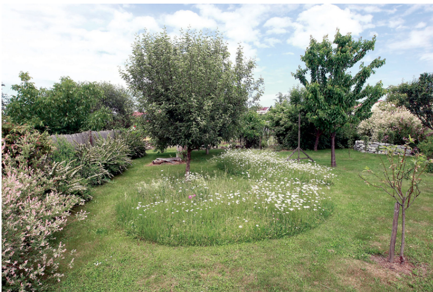
Ovocný sad s ponechanými refugii nesečených travin

Někdy ale jde o umělou podporu biodiverzity i vzhledu.