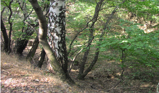
Místo ztráty panictví