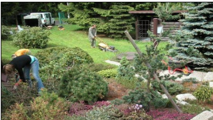
Touha po severu – severská zahrádka