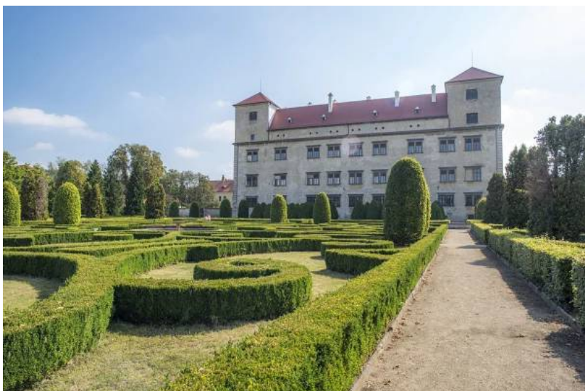
Soukromá Italská zahrada u zámku

Francouzské zahrady již signalizují jednak vybití všech nebezpečných šelem v krajině, jednak zvýšenou bezpečnost i mimo hradby, což umožňuje volně vstoupit do krajiny. Potřebné nahledy vytváří i umělé terasy.