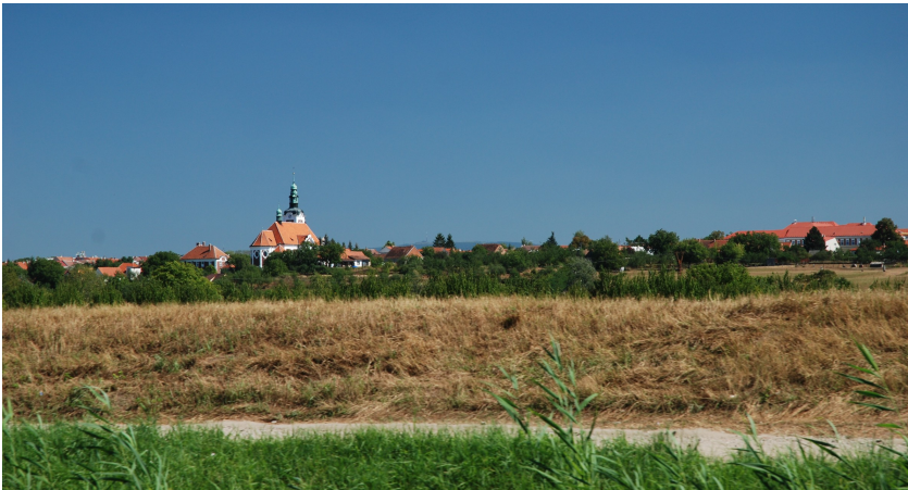
Vesnice jako čitelné místo

kteřá je v daném místě výjimečná může být výjimečná i vzhledem (kostel s věží). Čitelné místo umožňuje dobrou orientaci pro návštěvníky.