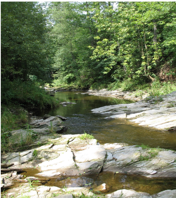
Lesní bystřina jako krásné, harmonické místo v přírodě