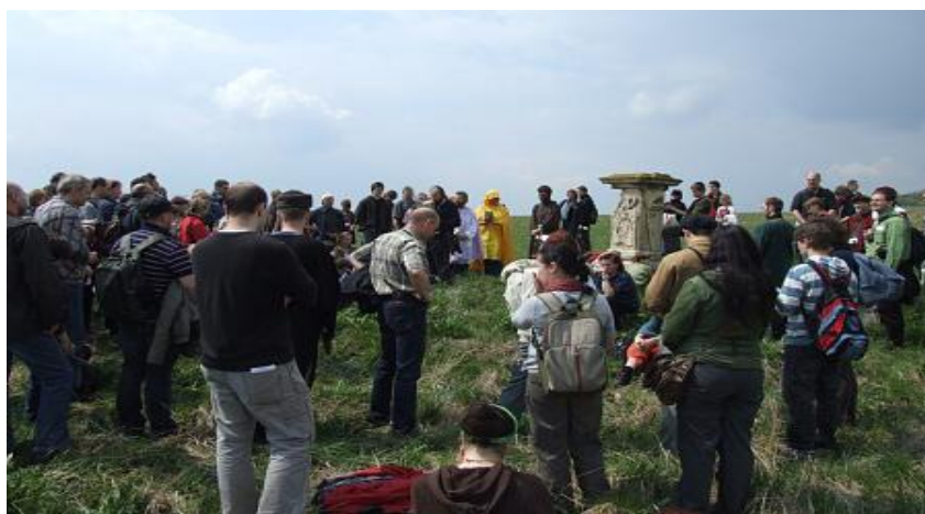
procesí za úrodu v polích

- procesí za úrodu. Ta se konala ve dvou termínech: na sv. Marka , aby bylo teplo a deštivo a v Křížových dnech (40 dní po Velikonocích), aby byla úroda bohatá a ochráněna před bouřemi. Rituál je u obou obdobný – brzy ráno průvod všech sedláků prochází za zpěvu a modliteb celou plužinou, kněz žehná všem pozemkům a ve čtyřech částech plužiny, u vhodného upomenutí, se koná krátká pobožnost. Na sv. Marka je procesí jen jednou, na Křížové (též prosebné) dny jde procesí čtyři dny po sobě (Po. až Čt.), vždy jinou cestou.