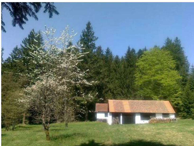
Odlesněná enkláva se samotou

Projevuje se zejména v krajinářských zámeckých parcích. Anglické, romantické zahrady na jedné straně formalisticky přebírají dekadentní, kulisovitou formou historizující motivy z linie „oáza“ (většinou z kavalírských cest mladých šlechticů do středomoří, později i celého světa), na straně druhé se opírají o výrazně atlantské klima Británie z lesní linie „palouk“, které po odlesnění přeje travním porostům. Zjednodušeně řečeno je anglický park stylizací běžné přioceánské krajiny ovčích pastvin s vtroušenými romantickými imitacemi jihu. Kulisovité stavební atrapy s nízkou nakrátko sečenou či pasenou trávou – anglický trávník (aby byl bez nadsledů vidět půdorys), orámovaný solitérními stromy.