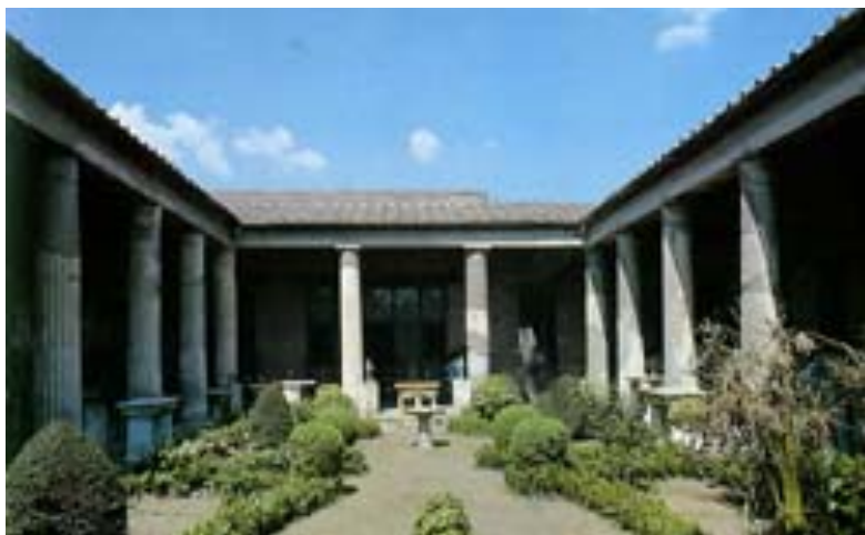
Peristyl antického domu

Tento princip připomíná i uzavřený prostor rajskeho dvora kontemplativních řádů ve středověkém klášteře, kde klauzura chrání nejen před nepřáteli, ale i svěským ruchem.