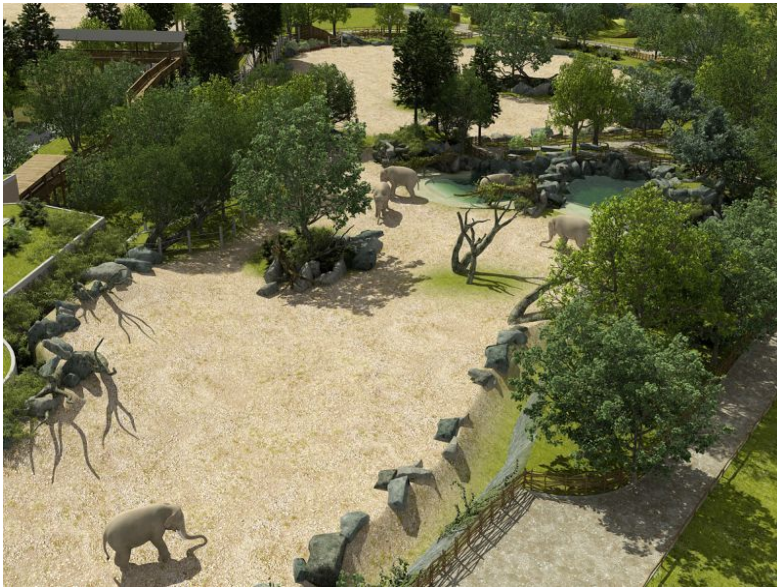
Imitace africké krajiny – výběh pro slony v ZOO

Inspirace je hledána v zvláště dramatických přírodních singularitách jak abiotických, tak živých. Ze stejného pojetí vychází i současné módní „zelené střechy a stěny“ (ve skutečnosti střechy pokryté suchomilnou, často exotickou vegetací, v případě stěn složitou soustavou pod sebou zavěšených truhlíků se závlahou, vytvářejících z popínavých rostlin iluzi vysoké vegetační stěny).