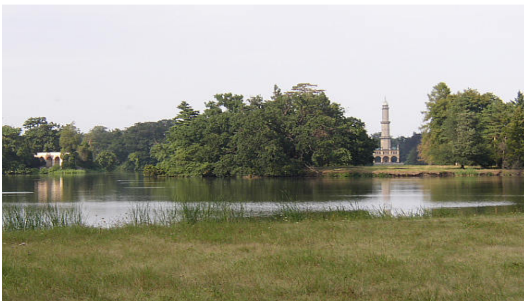
Imitace minaretu a aquaduktu v zámeckém parku

Projevuje se zejména v krajinářských zámeckých parcích. Anglické, romantické zahrady na jedné straně formalisticky přebírají dekadentní, kulisovitou formou historizující motivy z linie „oáza“ (většinou z kavalírských cest mladých šlechticů do středomoří, později i celého světa), na straně druhé se opírají o výrazně atlantské klima Británie z lesní linie „palouk“, které po odlesnění přeje travním porostům. Zjednodušeně řečeno je anglický park stylizací běžné přioceánské krajiny ovčích pastvin s vtroušenými romantickými imitacemi jihu. Kulisovité stavební atrapy s nízkou nakrátko sečenou či pasenou trávou – anglický trávník (aby byl bez nadsledů vidět půdorys), orámovaný solitérními stromy.