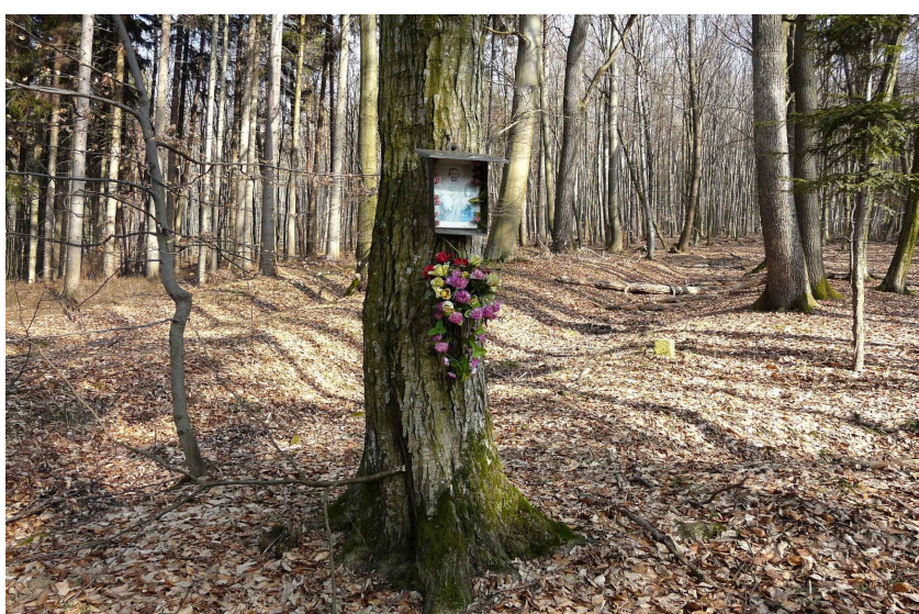
Obrázek záchrany andělem