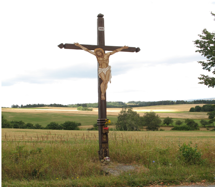
Kříž –poutní zastavení