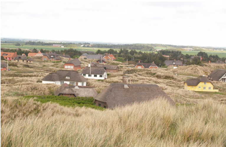
Obr. xx Popis (XX, xxxx)