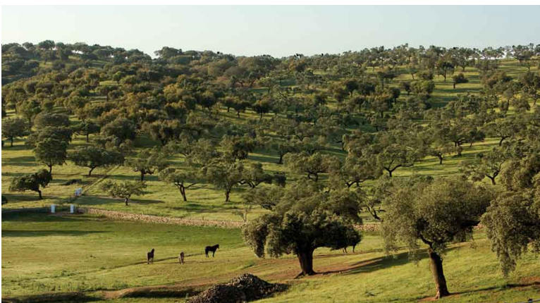
Obr. xx Popis (XX, xxxx)