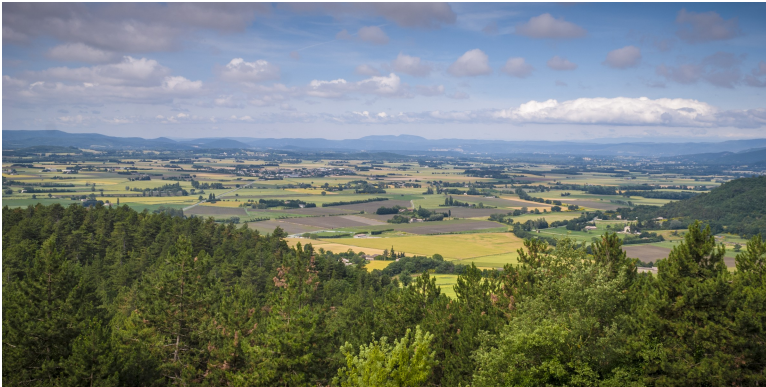
Obr. xx Popis (Lacina, xxxx)

14. Kontinentální otevřená pole – doznívání oceánského vlivu, roviny až pahorkatiny, nestejně velké plochy krajinných prvků, intenzivní obdělávání, lesy na temenech kopců.