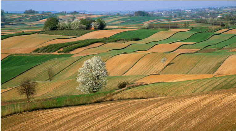
Obr. xx Popis (XX, xxxx)

26. Cultura promiscua – smíšené kultury - vrchoviny s úrodnými údolími, hlinité půdy, heterogenní, drobná mozaika, vysoká diverzita zemědělských plodin a kultur.