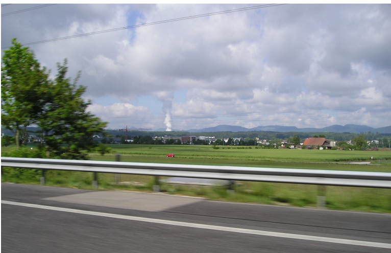
Obr. xx Popis (XX, xxxx)