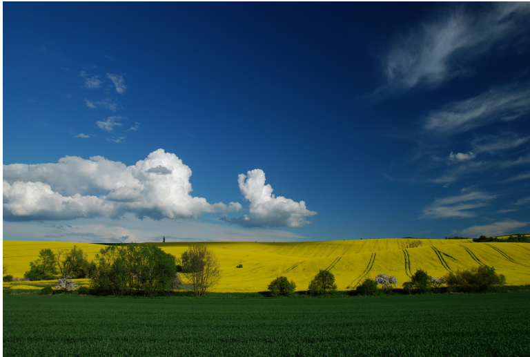
Obr. xx Popis (Lacina, xxxx)

18. Východní scelená pole – rovné a zvlněné pláně, kontinentální klima – černozemě, velké měřítko, homogenní, otevřená pole, v depresích louky.