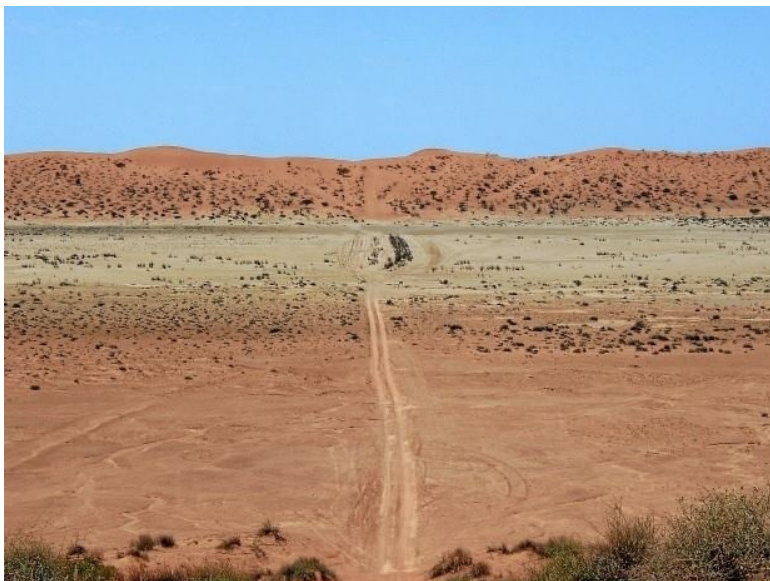
Obr. xx Popis (XX, xxxx)

Kategorie regionálních krajín (regionálně omezené specifické krajiny severního Německa, Nizozemí, Polska a Středomoří ), antropicky silně podmíněné krajiny – struktura plužin (samoty, délkové plužiny, směsi kultur, chudé krajiny Pyrenejského poloostrova). (3)