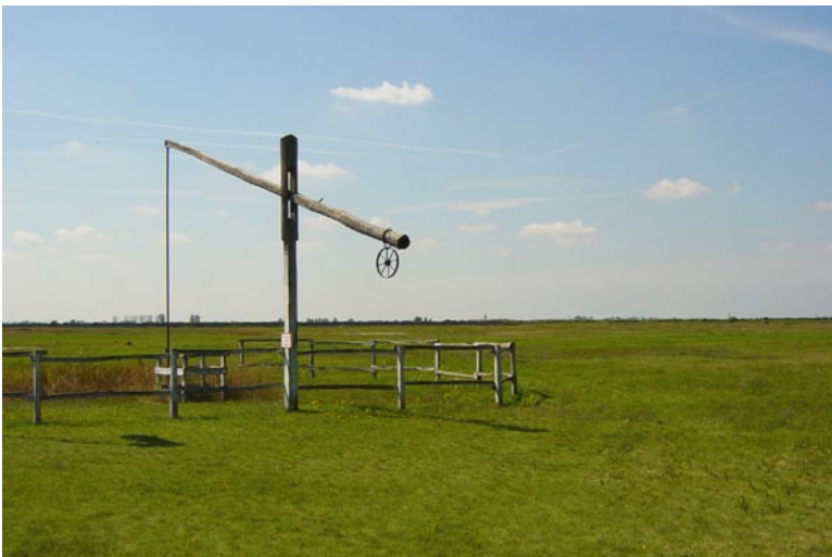
Obr. xx Popis (XX, xxxx)