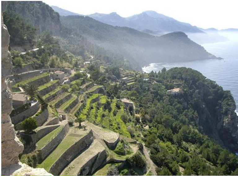
Obr. xx Popis (XX, xxxx)

Každý uvedený megatyp krajiny je jinak úrodný, a proto i různě vhodný k osídlení.