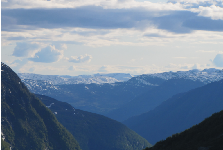
Obr. xx Popis (Havlíček, xxxx)

Kategorie uzavřených až polootevřených krajín = bocage – atlantské pobřeží mírného pásma a polootevřené zemědělské krajiny Evropy, vedle Španělska a oblastí střední Francie a jižního Německa zasahuje i na naše pohraniční hory a středoruské pahorkatiny. Následující typy jsou již běžné kulturní krajiny lesní až lesoplní, pole jsou uzavřena v lesích – původně celá kolonizovaná středověká krajina, vždy méně úrodná než krajiny otevřené. (3)