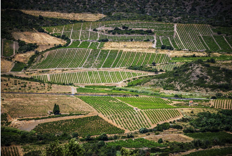
Obr. xx Popis (Lacina, xxxx)

Kategorie stepí a suchých krajin = pouští (semiaridní podnebí Maďarska, Rumunska, Ukrajiny a Ruska) zasahuje do Evropy od východu – západní okraj velké stepi – přechod k předchozím, rejdiště kočovníků, proto byly vylidněny a dosídleny až v novověku. (3)