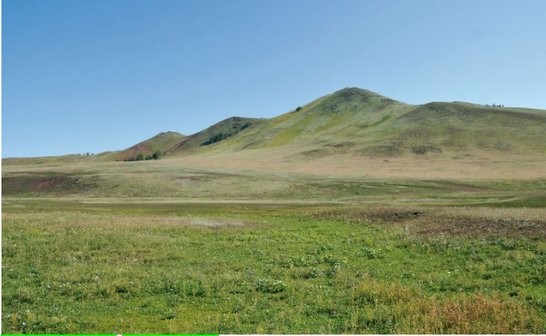
Obr. xx Popis (XX, xxxx)

22. Polopoušť – suché, často zasolené, otevřené, extenzivně obhospodařované nížiny, řídký porost odolných travin.