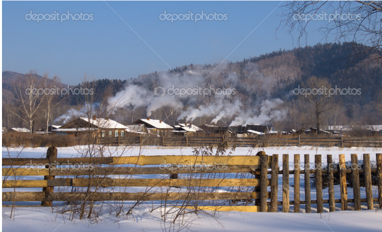
Obr. xx Popis (XX, xxxx)

Kategorie krajín alpského bezlesí v severských vrchovinách s vřesovišti a rašeliništi Skotska, západního Irsku a Norska a části vysokohorských poloh - nad alpskou hranicí lesa, s keříčkovou vegetací jako analogii tundry, směrem dolů s přílehlým sledem regionálně rozmanitých vegetačních stupňů s charakterem „extrazonální tajgy“ - Pyreneje (Španělsko, Francie), Alpy (Francie, Itálie, Švýcarsko, Rakousko); vysokohorská část Karpat (Slovensko, Polsko, Ukrajina, Rumunsko) a Vysokého Balkánu (ve státech bývalé Jugoslávie).