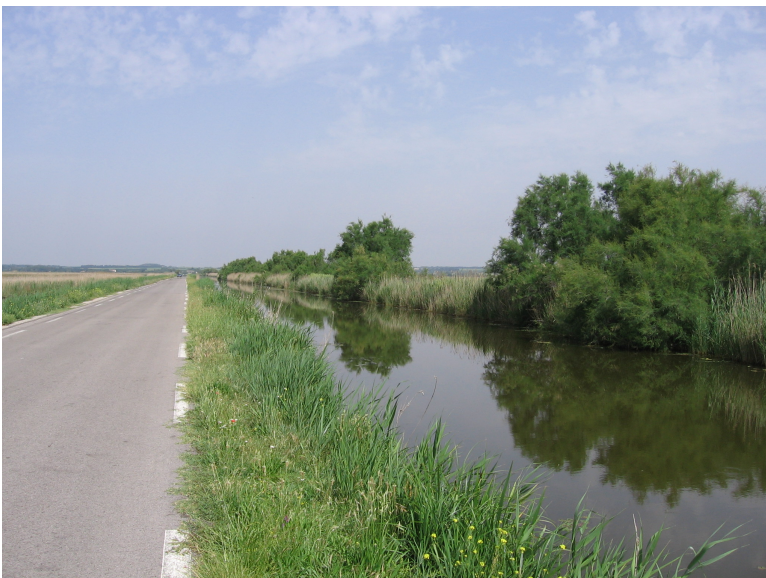
Obr. xx Popis (?Eliška xxxx)