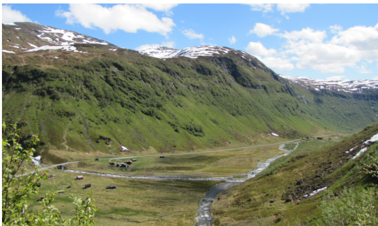
Obr. xx Popis (Havlíček, xxxx)