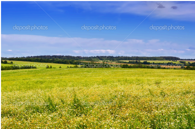
Obr. xx Popis (XX, xxxx)