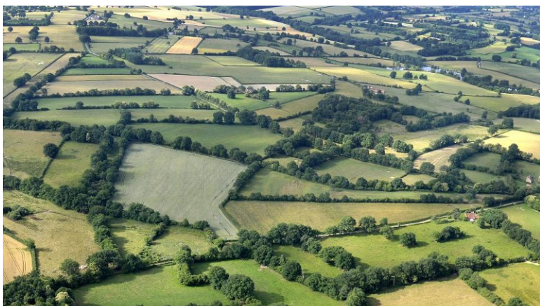
Obr. xx Popis (XX, xxxx)

11. Semibocage – přechod mezi uzavřenou a otevřenou krajinou, vlhké vrchoviny až hornatiny, mozaika smíšených lesů, extenzivních pastvin a orné půdy.