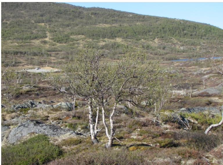
Obr. xx Popis (Havlíček, xxxx)