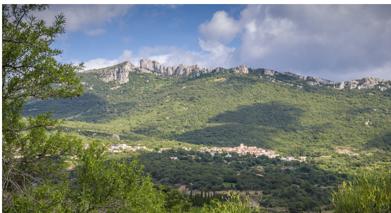
Obr. xx Popis (Lacina, xxxx)