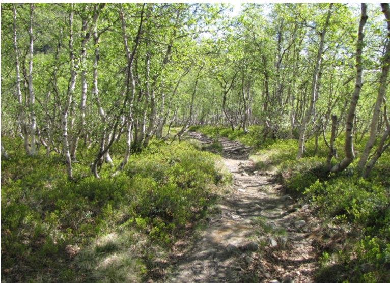
Obr. xx Popis (Havlíček, xxxx)