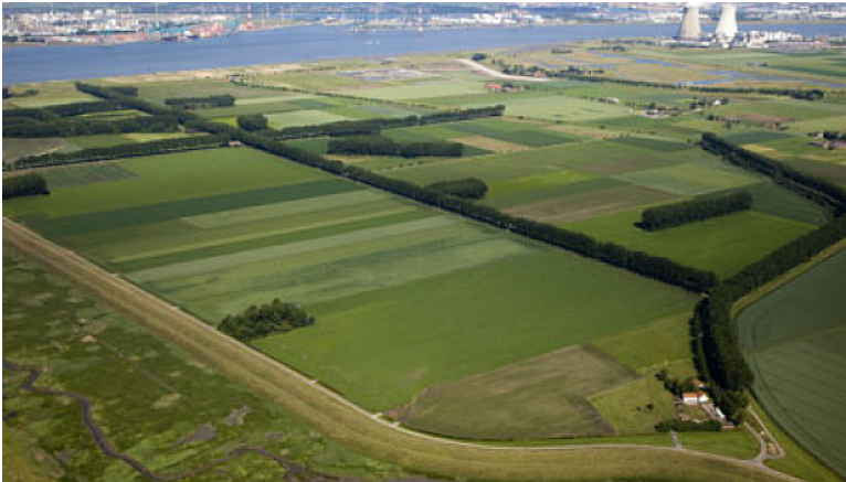
Obr. xx Popis (XX, xxxx)

29. Deltý – estuária a široké nivy velkých řek v pobřežních rovinách, zavlažovaných z řek, intenzivní, ploché, uniformní ale úrodné.