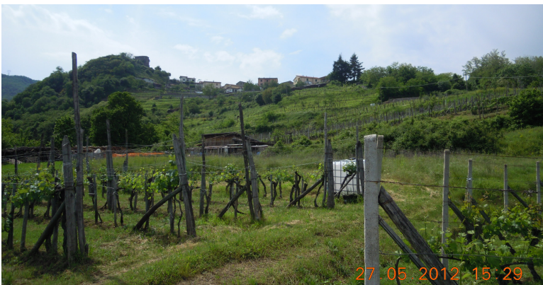
Obr. xx Popis (?Eliška, xxxx)

27. Dehesa / montado – chudé, suché a kamenité půdy na mírných svazích a plošinách, lesozemědělská (pastviny, korkový dub) pastorální krajina.