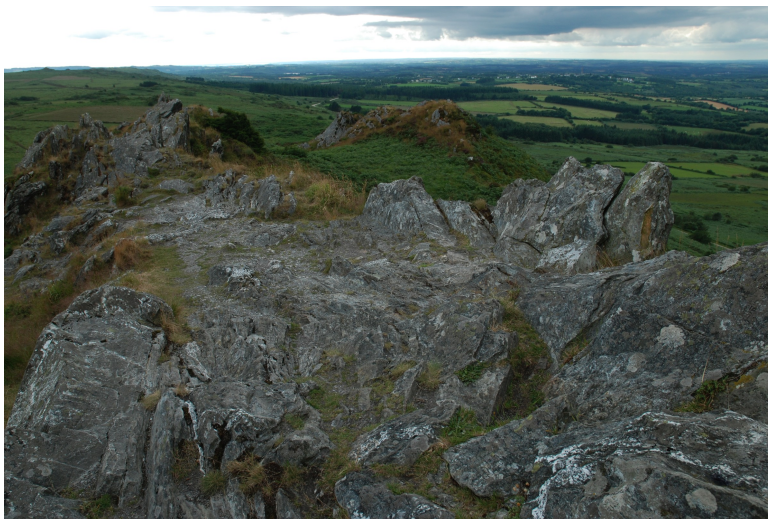
Obr. xx Popis (Lacina, xxxx)