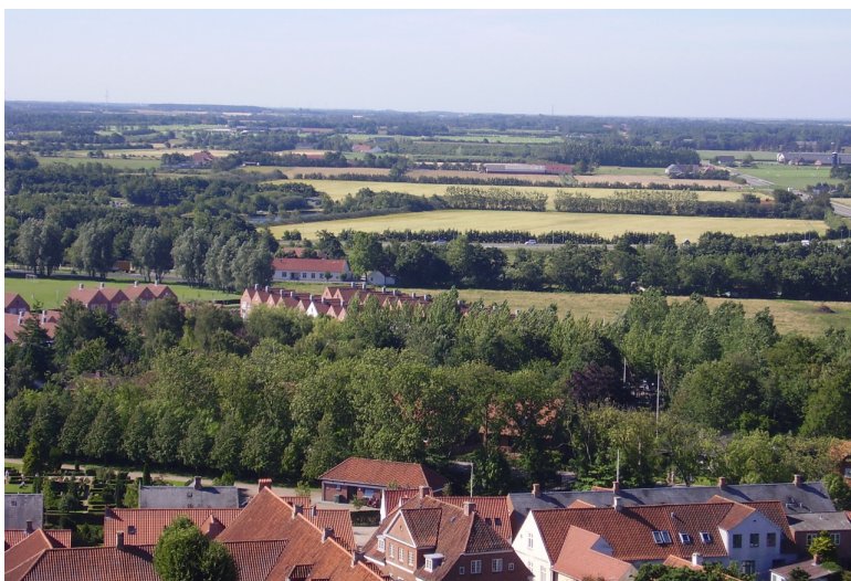
Obr. xx Popis (XX, xxxx)

25. Polská pásová políčka – zvlněný reliéf, intenzivní (ale maloplošné) obdělávání, velká diverzita na malé ploše, pásy za statky.