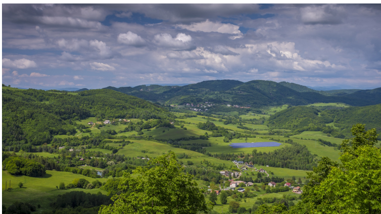
Obr. xx Popis (Lacina, xxxx)

12. Mediteránní semibocage – relativně otevřené, suché vrchoviny a hornatiny, extenzivní zemědělství, trvalé kultury, kamenice a zídky.