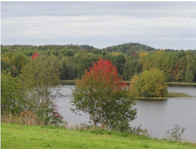
Obr. xx Popis (XX, xxx)