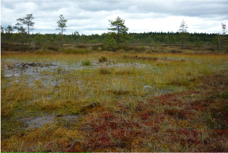
Obr. xx Popis (XX, xxxx)

4. Severní tajga – jednotvárné, homogenní lesy (modřín, bříza, smrk, borovice), v lesních zbytcích extenzivní pastva.