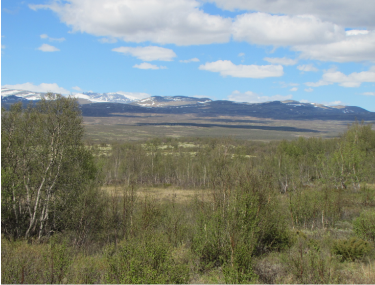
Obr. xx Popis (Havlíček, xxx)

6. Jižní tajga – rozvolněné lesy (smíšené jehličnaté, menšina pastvin), pahorkatiny a roviny, půdy hlinité a písčité.