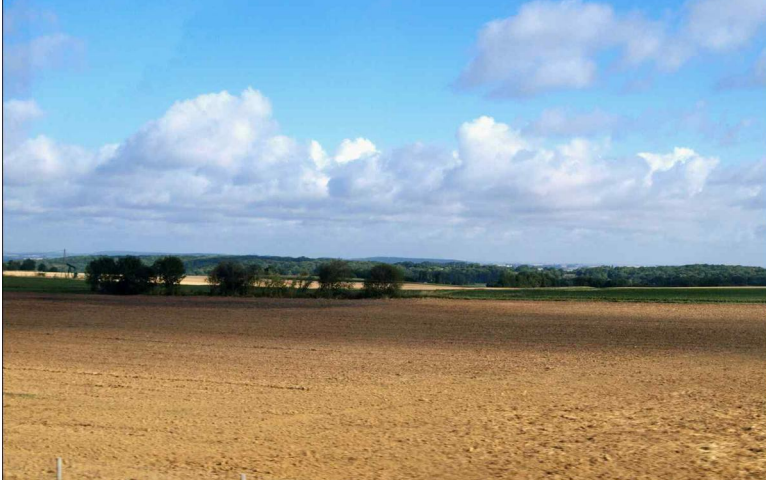
Obr. xx Popis (XX, xxxx)

16. Původně otevřená pole – zvlněné pláně, půdy hlinité a jílovité, chladnější oceánské klima, v čase se měnící, intenzivně obdělávané, velké plochy polí či pastvin, bezlesé střídání kultur, s osamělými farmami.