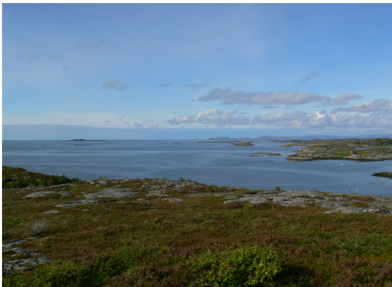
Obr. xx Popis (Havlíček, xxxx)

2. Lesotundra – většinou zaujímá poměrně úzký pás táhnoucí se v rovnoběžkovém směru. Zprvu se objevují jednotlivé stromy, na otevřených plochách se ještě uplatňuje tundrová vegetace s četnými rašeliništi a jezírky. Objevují se smrky, v údolích břízy, olše.